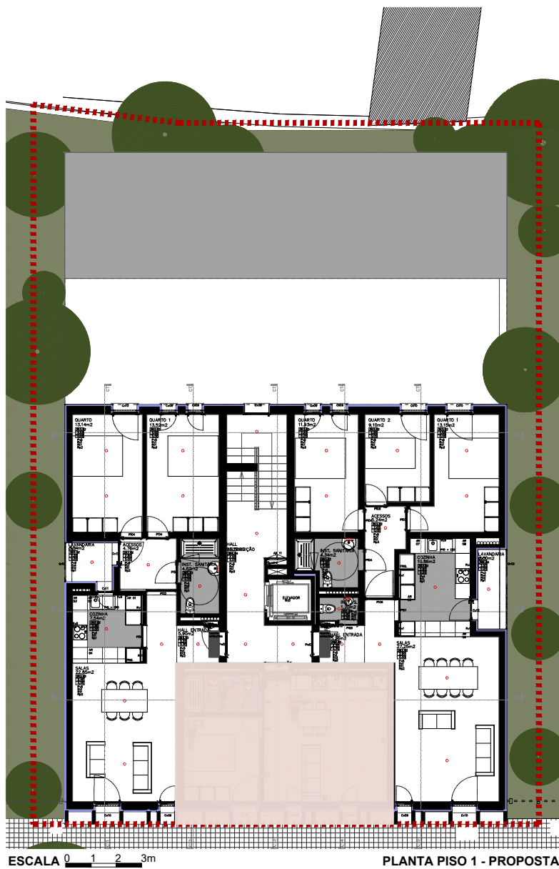
PLANTA PISO 1 - PROPOSTA